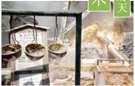
お湯かけ弁財天 なぎの木

温泉槽のすぐ隣にまつられています。銭洗いの池でお金を洗うと金運がアップするとか。また、ここにある「なぎの木」は「縁結びの木」だそうです。絵馬を結んでみてはいかがでしょうか。 MAP1