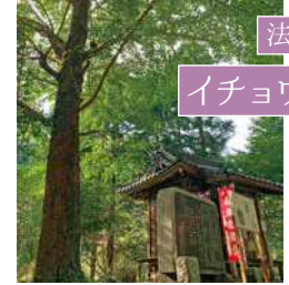
法華寺 イチョウの木

万葉集に詠われた花沢の里にあり、地元では「乳観音さん(ちっちーかんのんさん)」と呼ばれ親しまれています。木の幹がお乳のように垂れ下がっていて、触ると乳がよく出るようになると言われています。 MAP17