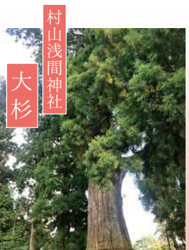
村山浅間神社 大杉

富士山を信仰する者の修行の場であり、かつて村山登山道の起点でもあった神社です。境内には数多くの巨木が林立し、中でも御神木である樹齢1000年以上の大杉と大銀杏は見事です。 MAP12