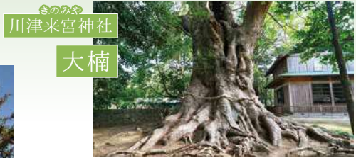
きのみや 川津来宮神社 大楠

河津にも来宮神社があります。境内では、樹齢1000年以上と言われる大楠のパワーを静かに感じられます。12月には7日間酒を断ち、鶏肉を食べない「鳥精進・酒精進」という珍しい風習があり、氏子や崇敬者により守り伝えられています。 MAP3