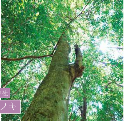
静岡縣護國神社 モチノキ

旧鎮座地より移転する際に埋め立て整備されたため、樹木はすべて植林されたものですが、このモチノキは元々自生していたものです。推定樹齢200年、高さ20mで、静岡県護國神社の御神木とされています。 MAP15