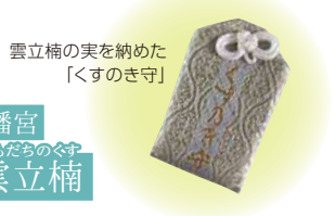
雲立楠の実を納めた「くすのき守」