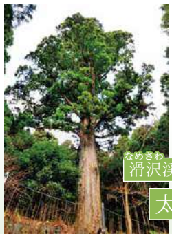
滑沢溪谷奥 太郎杉

天城随一の溪流美が楽しめる滑沢溪谷、太郎杉歩道の奥に「太郎杉」はあります。途中でワサビの美しい段々畑に癒されながら、「森の巨人たち百選」にも選ばれたこの巨木からパワーを頂きましょう。 MAP8