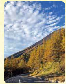
紅葉の見頃は例年9月下旬～10月下旬

富士山麓を走る富士山スカイライン。富士登山のみならず、ドライブコースとしても人気です。桜、新緑、紅葉など裾野に広がる自然林が季節ならではの癒しを与えてくれます。