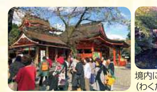
境内にある湧玉池(わくたまいけ)

富士山を御神体とする浅間大社は富士山信仰の始まりの地です。格式高く威風堂々として美しい! 富士山の雪解け水が湧出する「湧玉池」は清らかなパワースポットとしても有名です。