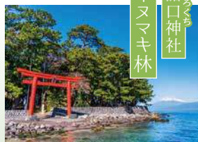
伊ヌマキ林 諸口神社