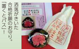
酒落がきた合格祈願のお守り

山の神、海の神そして水の神である祭神を祀る伊那下神社の鳥居をくぐると現れる、樹齢1200年の大いちょう。この木は落雷を受けた霹靂木で、「困難に負けない常若の生命力」を持ち、龍が宿っていると言われています。 MAP4