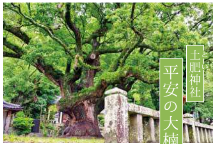
土肥神社 平安の大楠