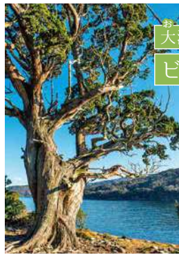
大瀬崎 ビャクシン樹林

付近一帯が約130本のビャクシンに覆われており、ビャクシンの自然群生地としては日本の最北端にあたります。大瀬神社境内の神池は海からわずかな距離にもかかわらず真水の池で、伊豆七不思議の一つに数えられています。 MAP10