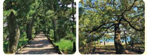
神の道を進むとその先には…

御穂神社から海岸まで続く参道「神の道」のクロマツの古木を通り抜けた先にあります。地面まで届く長い下枝が特徴で、現在の松は3代目です。 MAP13